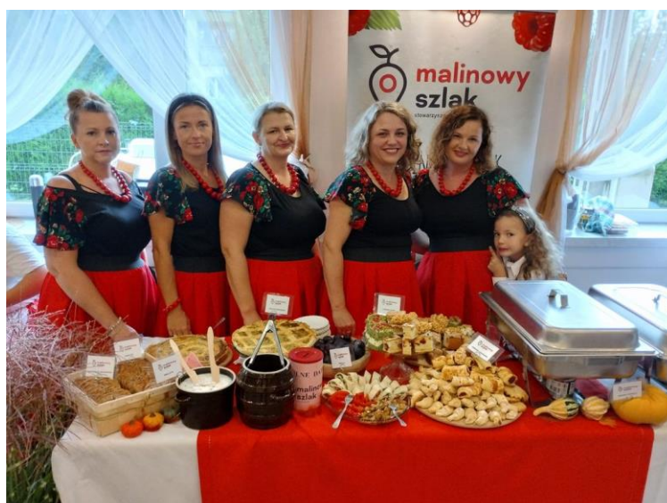
Stowarzyszenie „Malinowy szlak”