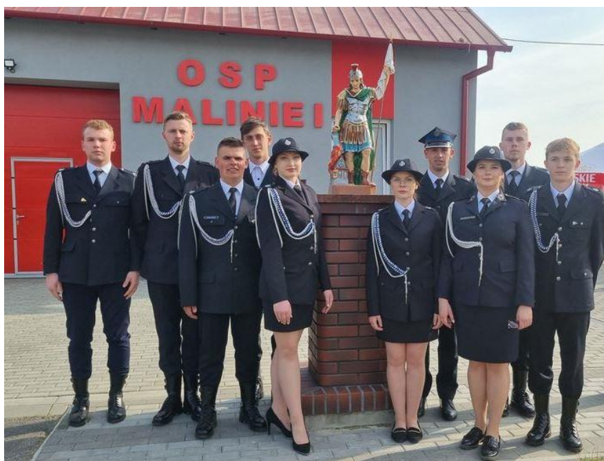
OSP Malinie I