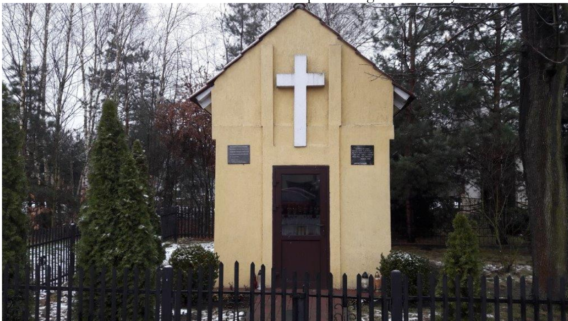
Kapliczka Matki Boskiej Anielskiej jako votum za cudowne ocalenie mieszkańców Malinia przed pacyfikacją w 1944 r.