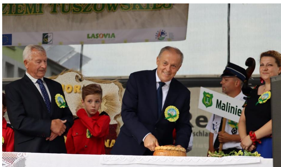
Dożynki w Sołectwie Malinie 2022 r.