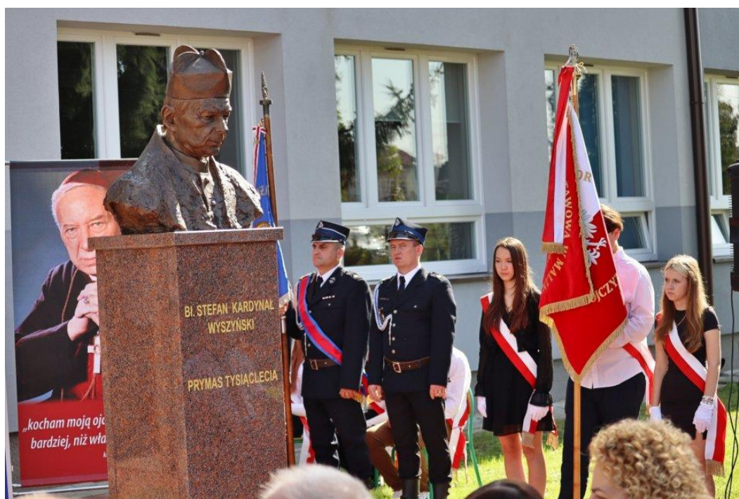
Pomnik bł. Stefana Kardynała Wyszyńskiego – patrona szkoły w Maliniu.