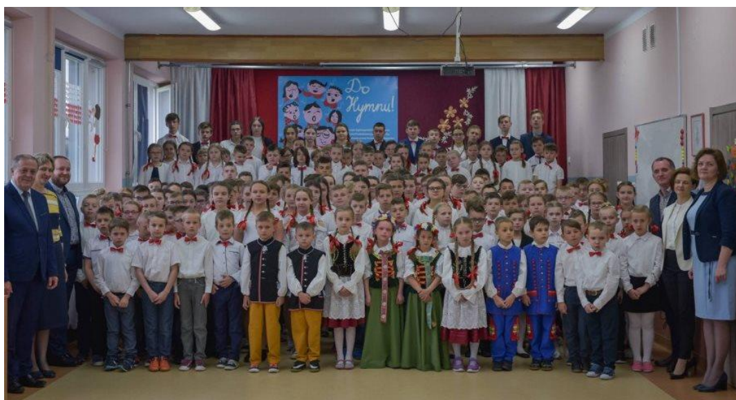
Uczniowie ZS w Maliniu