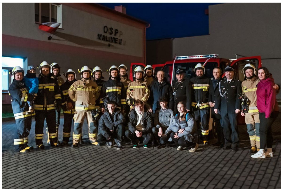
Ochotnicza Straż Pożarna w Maliniu II