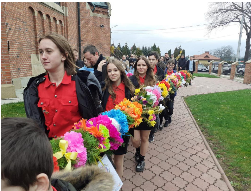
Delegacja Sołectwa Malinie z palmą wielkanocną