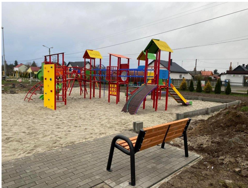
Wiejski plac zabaw.