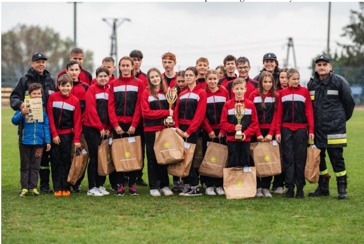
Ochotnicza Straż Pożarna w Maliniu II – Drużyna Młodzieżowa