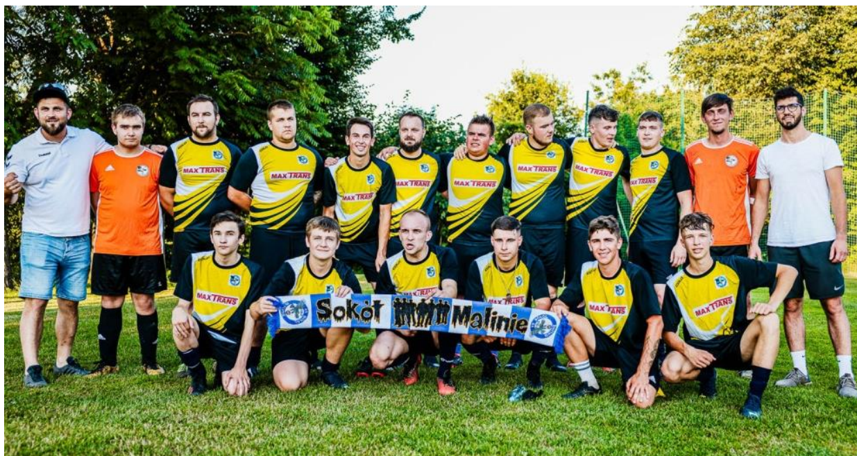
Ludowy Klub Sportowy „SOKÓŁ” Malinie