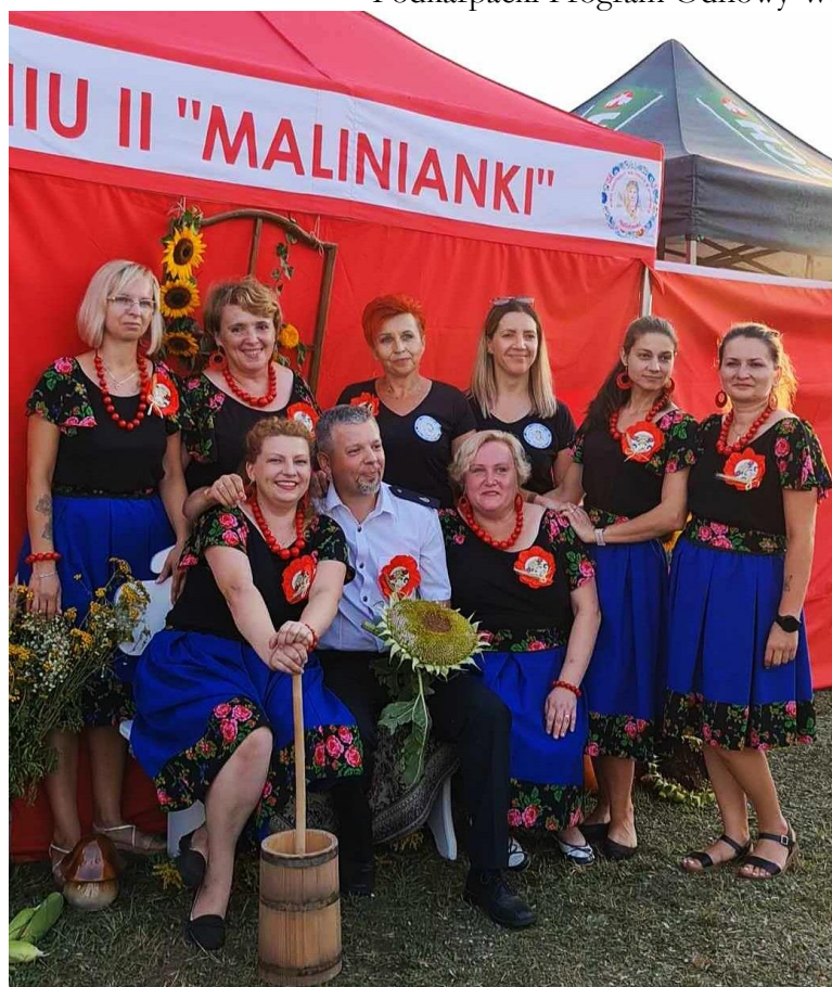
Kotłownia Gospodyń Wiejskich w Maliniu