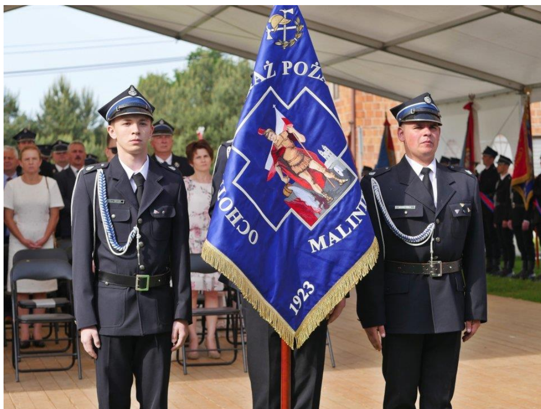
Obchody 110-lecia OSP w Maliniu I