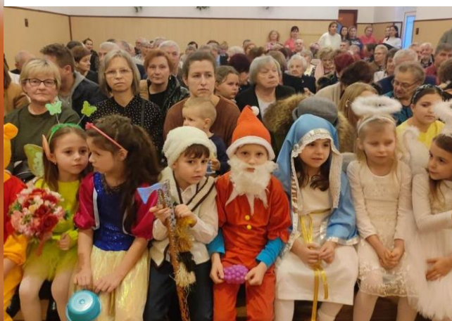
Spotkanie noworoczne dla mieszkańców