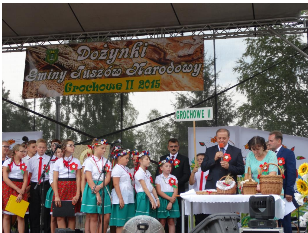
Gminne dożynki 2015.