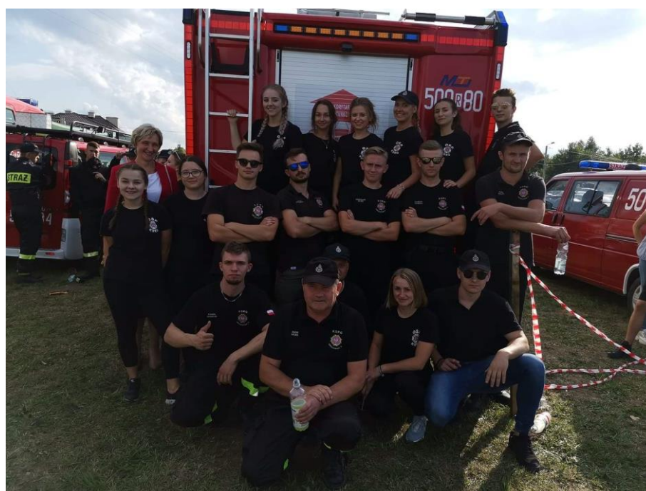
Drużyny OSP Grochowe II