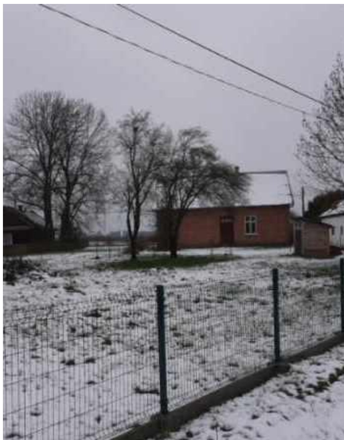
Budynek starej szkoły.