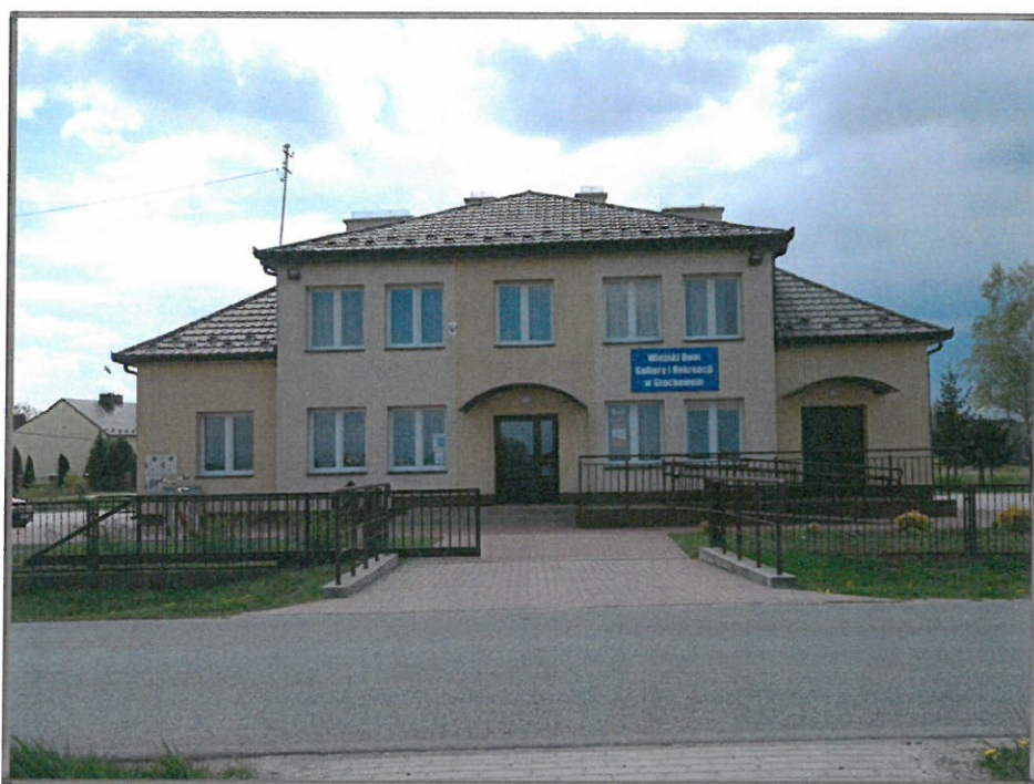
Wizytówką wsi jest Wiejski Dom Kultury i Rekreacji w Grochowie