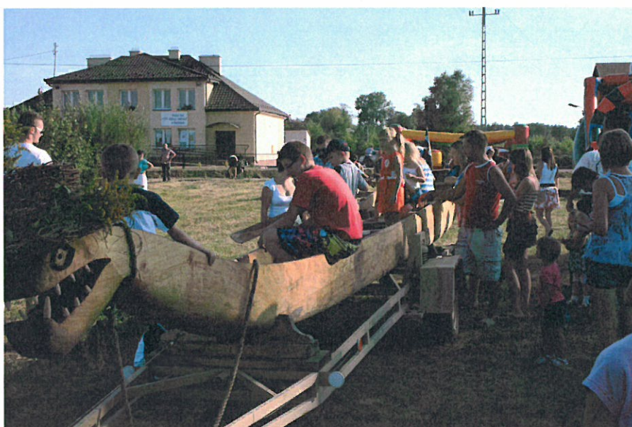
Festyn rodzinny w Grochowem