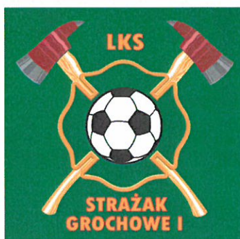
Ludowy Klub Sportowy STRAŻAK Grochowe I