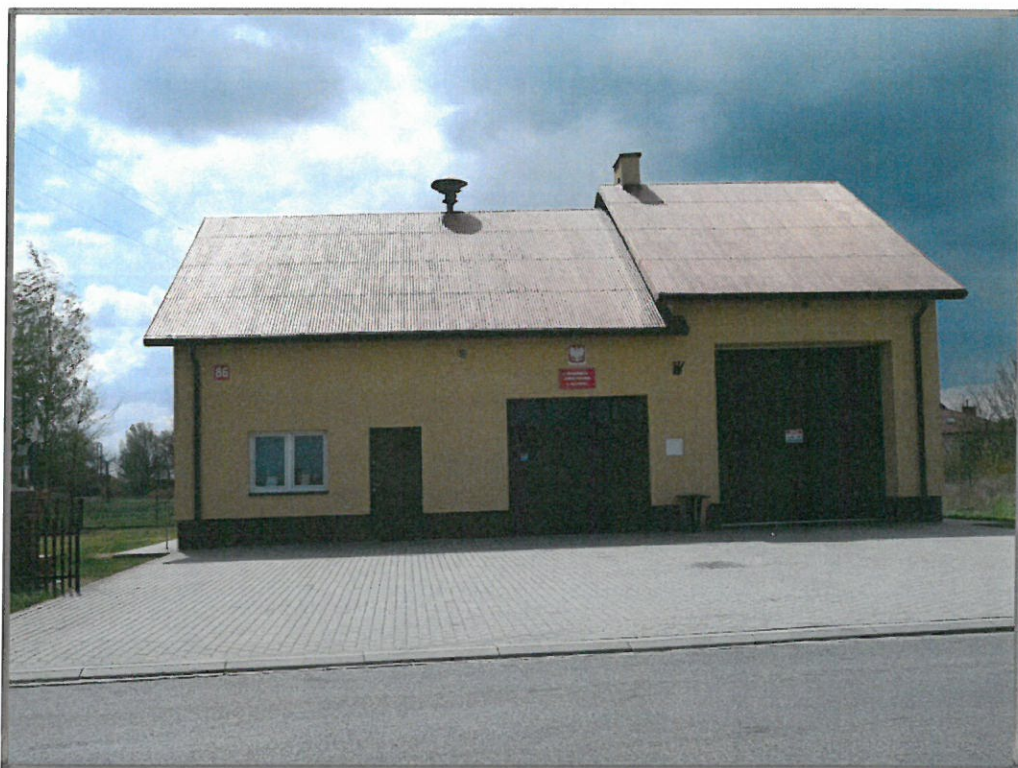
Budynek OSP w Grochowie I