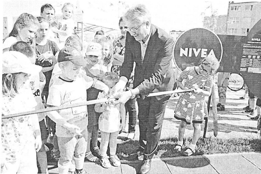
Srem--_Zdjecia z otwarcia_NIVEA_P_2016 (8).jpg